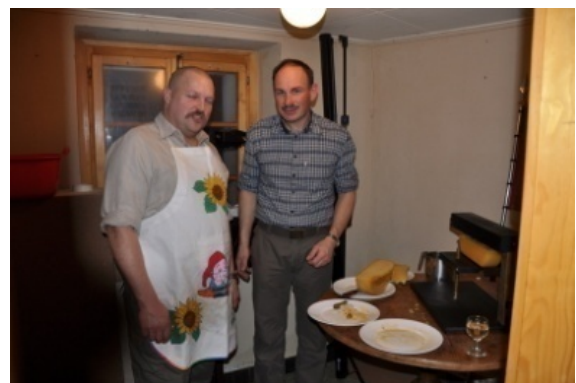
Gemeinderäte im Einsatz - ein gutes Team!