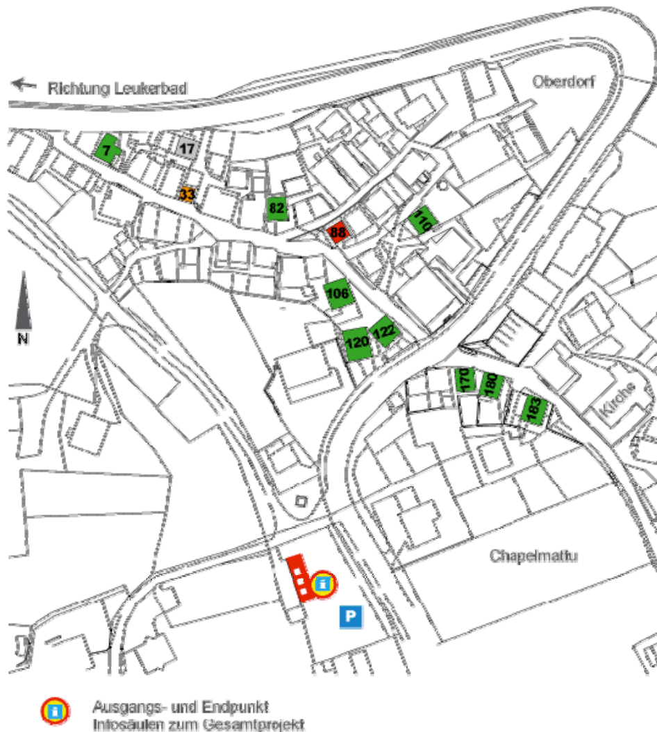
Übersicht über Gebäude zum Kauf und Umnutzen in Inden. Mehr Infos unter www.agitatus.ch .