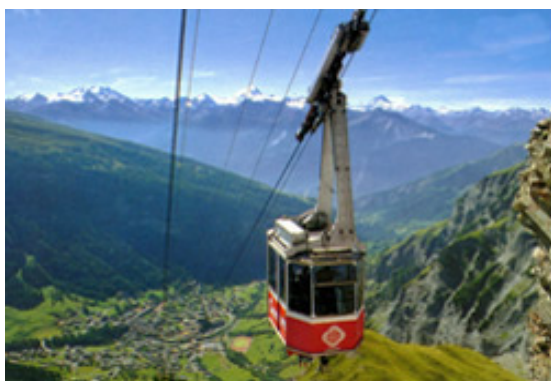
Gondelbahn auf die Gemmi

Erfreulicherweise konnte ein weiteres Angebot in unser Abonnement aufgenommen werden. Alle Abo-Besitzer können die Gemmibahnen sowie die kleine Bahn kostenlos nutzen. Im Winter ist die Schlittenbenutzung ebenfalls gratis. Es ist jeweils die Inden-Abo-Karte vorzuweisen, dieses Angebot wird neu direkt auf der Karte integriert sein. Viel Vergnügen mit dem neuen Angebot.