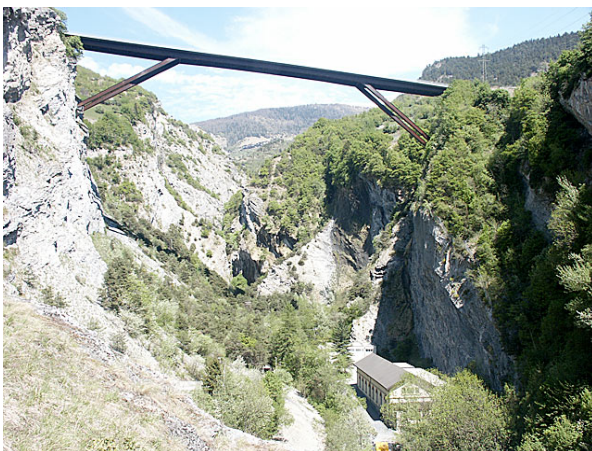
Kraftwerk Dala heute