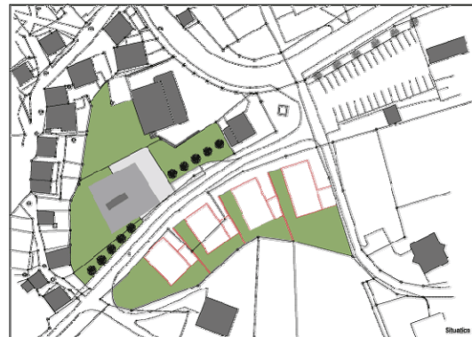
Bauparzellen welche zu vergeben sind.

Der Gemeinderat hat sich zur Aufgabe gemacht, weitere Parzellen an bauwillige Personen zu vermitteln.