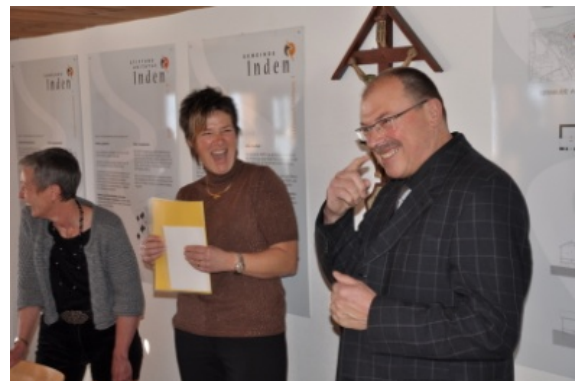
Das berühmte „weinende und lachende Auge“.

Hier einige Impressionen zu diesem sicherlich emotionalen Anlass: