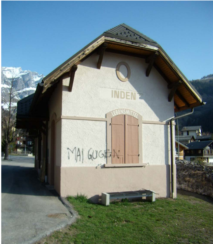
Vandalismusakt am "Dorflädeli"

Anfangs April 2009 wurde die Südseite des alten Bahnhofgebäudes mit schwarzer Farbe besprayt.