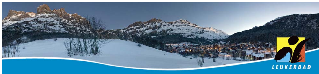
Abendlicher Blick auf den Thermalbadeort Leukerbad

Basierend auf bestehenden Lösungen wird ein eigenes System für Leukerbad resp. den Kanton Wallis entwickelt. Dabei wird in einem ersten Schritt ein einheitliches elektronisches Meldewesen eingeführt. Darauf basierend ist eine Gästekarte z.B.: in Form eines Zutritts- und Bonussystems geplant.