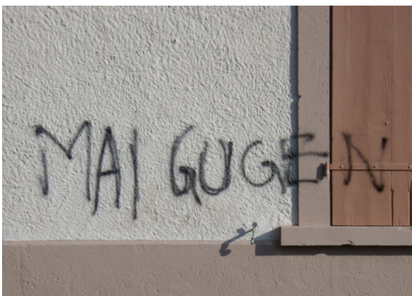
Mit "MAIGUGEN" besprayte Südwand

Die Gemeinde hat daraufhin bei der Kantonspolizei Strafanzeige erstattet. Die Verwaltung gibt dem Verursacher die Möglichkeit, sich bei der Polizei zu melden, damit die Angelegenheit ohne grosse Sache geregelt werden kann. Alsdann wäre man bereit die Anzeige zurückzuziehen.