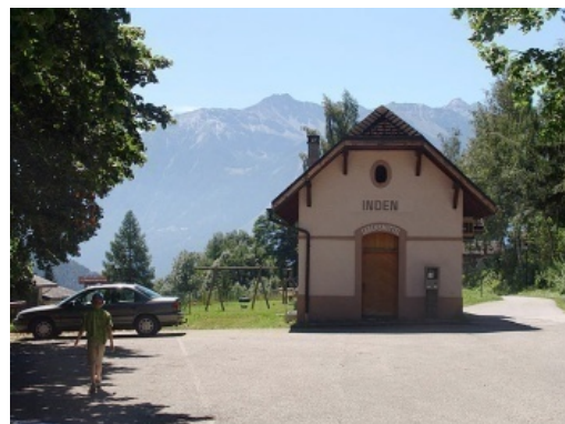
Altes Bahnhofsgebäude, heute Dorfladen

Das alte Bahnhofareal soll neu gestaltet werden. Für dieses Jahr ist die Projektierung geplant.