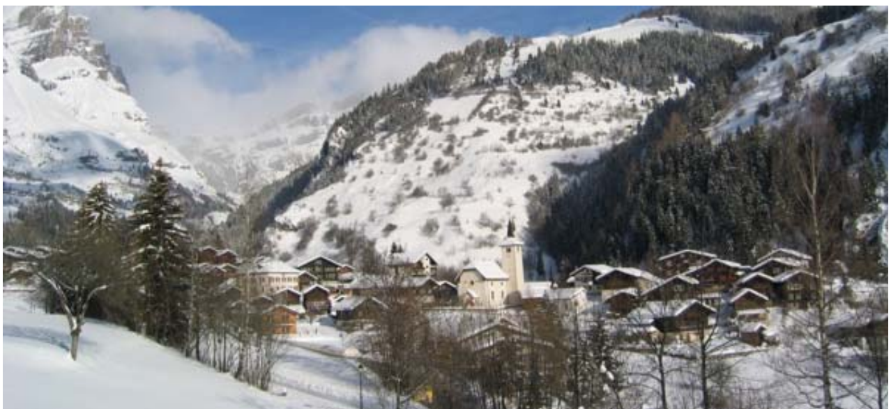
Inden im Winter