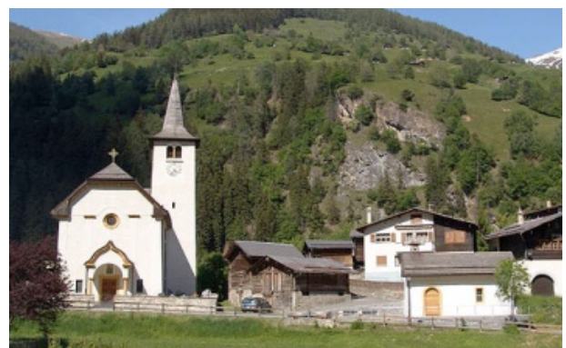
Kirche und Kapelle von Inden

Am Donnerstag, 23. Oktober 2008 wurde der Kapellenweg von Leukerbad über Inden, Tschingeren, Dorbu und zurück nach Leukerbad eröffnet. Auch die dem heiligen Mönchsvater Antonius geweihte Kappelle von Inden ist im Kapellenweg integriert. Auf jeden Fall ist der Kapellenweg ein Ausflug wert: 5 Dörfer, 8 Kapellen, eine atemberaubende Bergwelt und Kleinode von Bauwerken mit Jahrhunderten an Geschichte. Der Kapellenweg ist ein Angebot für Körper, Geist und Seele. Die Wanderung dauert rund fünf Stunden und ist ein unvergessliches Erlebnis für Jung und Alt. Einen Vorgeschmack zum Kapellenweg oder den Zugang zu einem Führer in Buchform finden Sie unter www.kapellenweg.info .