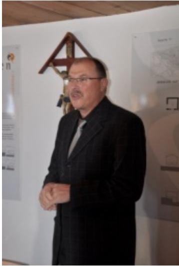
Der scheidende Präsident bei der Abschiedsrede

Nachstehend nur einige Auszüge aus den Gemeinderatsprotokollen der letzten 28 Jahre, die zeigen, was alles zu tun gewesen war.