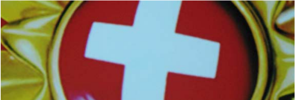
Bildausschnitt aus Logo Schweiz Tourismus