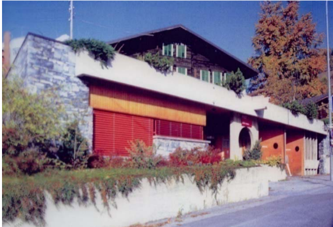
Gemeindebüro von Inden mit Mehrzweckhalle und Post

Öffnungszeiten Gemeindebüro Mittwoch: 09.00 – 11.00 Donnerstag: 15.00 – 17.00 Telefon 027 / 470 28 56 Fax 027 / 470 28 61