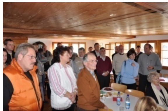
Die Bevölkerung ist bei der Dankesfeier rege vertreten.