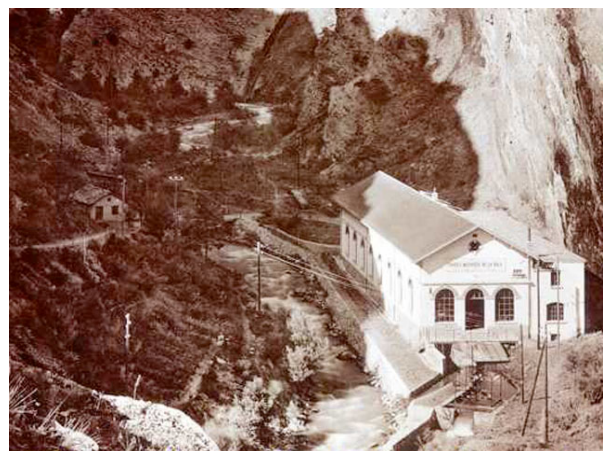
Kraftwerk Dala einst