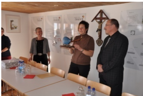
"Fridolin" wird übergeben