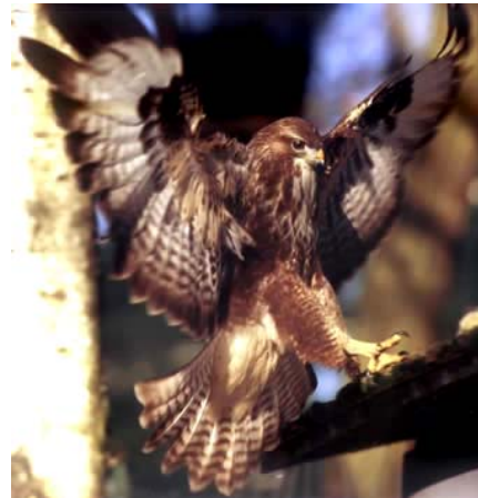
Falke; Falknerei, auch Beizjagd genannt.

Ich arbeite als Metzger in Chermignon in der Grossmetzgerei Chermignon SA. Nebenbei bin ich in meiner Freizeit Bienenzucht-Berater und betreibe selbst als Imker die Belegstelle Rumeling. Ich habe zwischen 80 und 120 Bienenvölker. Hinzu kommt die Jagd, welche ich aber seit 5 bis 6 Jahren nicht mehr aktiv betreibe. Für dieses Hobby habe ich zu wenig Zeit. Hingegen fische ich gerne, genauer das Fliegenfischen. Eine neue Freizeitbeschäftigung von mir ist die Falknerei.