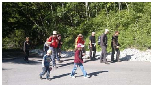
Sportlich macht sich eine Gruppe zu Fuss in Richtung Gmeiweid auf den Weg