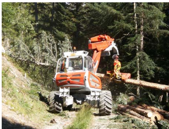
Rationelle Nutzung durch modernen Maschineneinsatz (Schreitbagger mit Vollerteragrat „Woody 50“)

Bei einem Spaziergang können Sie die Ergebnisse der guten Arbeit des Forstbetriebs Sonnenberge-Dala (FBSD) begutachten. Der herausgepflegte Buchenwald ist nämlich eine Besonderheit