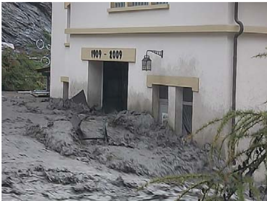
Die Wasser-Schlamm-Massen strömten frontal beim Gebäude ein ...

Am 10. Oktober letzten Jahres verzeichnete man im Bereich der Dala innerhalb weniger Stunden einen massiven Anstieg der Wassermassen. Nach Schneefällen am Wochenende und anschliessend anhaltenden Regenschauern trat die Dala über die Ufer.