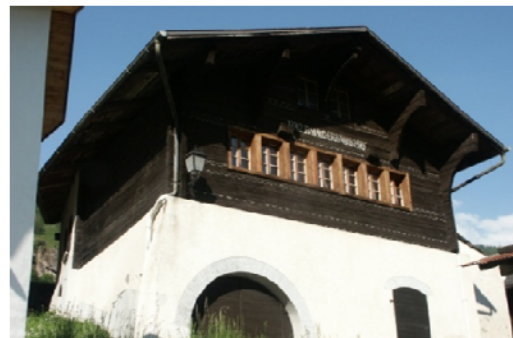
Burgerhaus mit Burgerstube in Inden

Die Burgerstube kann für private oder öffentliche Anlässe gebucht werden. Die Miete beträgt Fr. 50.- pro halbem Tag (nur Stube) oder Fr. 150.- für den ganzen Tag (inkl. Benützung der Küche und des Geschirrs).