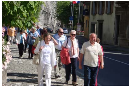
Gut zu Fuss, die Teilnehmenden unterwegs

Der Seniorenausflug war ein gelungener Anlass und die Seniorinnen und Senioren warten bereits voller Vorfreude auf den nächsten gemeinsamen Anlass.