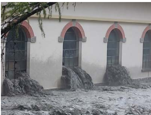
... und traten durch das Fenster wieder aus.

Ab 10 Uhr stieg der Wasserpegel der Dala massiv an. Mit Angestellten, Feuerwehr und Baumaschinen versuchte man den reissenden Fluss vom Kraftwerk fernzuhalten. Vergeblich. Die Dala führte im Laufe des Tages immer mehr Hochwasser, so dass die Mitarbeiter der ReLL AG und der Kraftwerke Dala AG gezwungen waren, das Gebäude zu räumen. Verletzt wurde niemand.