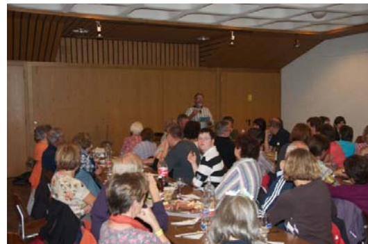
„Zällätä“ über Bodmen

Im Pfarreizentrum wurde die Teilnehmer anschliessend zu einem feinen Imbiss und „Zällätä“ von Bodmen erwartet.