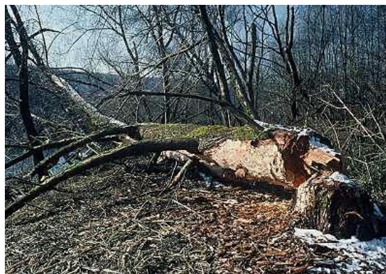
Holz mit mehr als 20cm Durchmesser

Übertretungen dieses Beschlusses werden auf Grund der Anzeige des Revierförsters gemäss Gesetz geahndet.