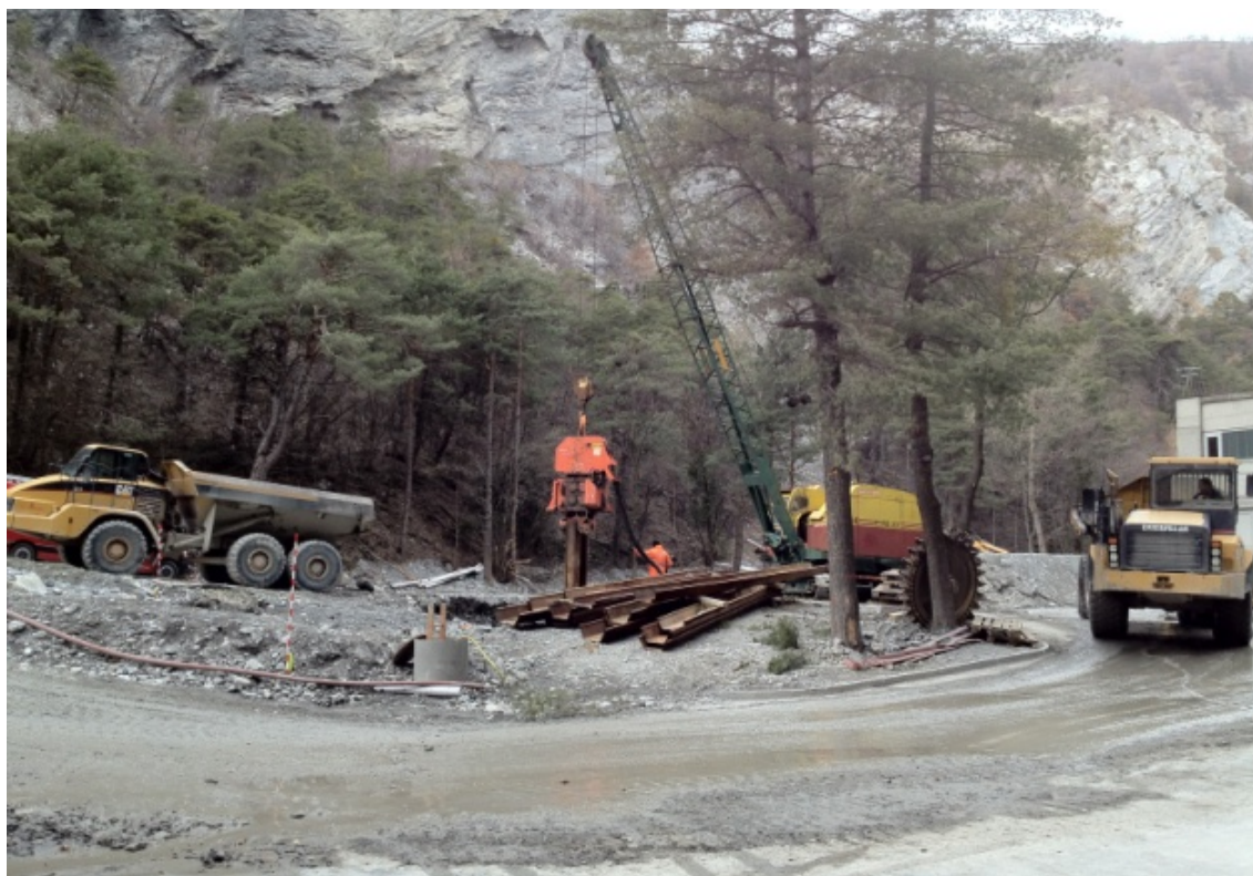
Massive Aufräumarbeiten im Wald vor dem KW Dala

Die Stromversorgung der Gemeinden Leuk, Varen, Inden, Albinen und Leukerbad ist vom Ausfall des Kraftwerkes nicht betroffen. Dies wird durch das Unterwerk Leuk sichergestellt, bei welchem das Versorgungsnetz am 65kV Verteilnetz der Valgrid angeschlossen ist.