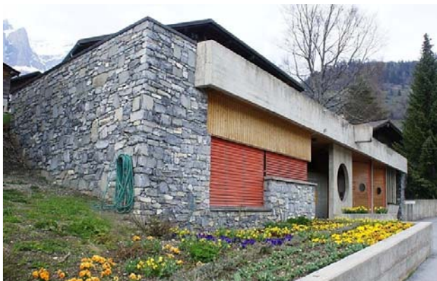
Mehrzweckgebäude mit Gemeindebüro und Poststelle in Inden