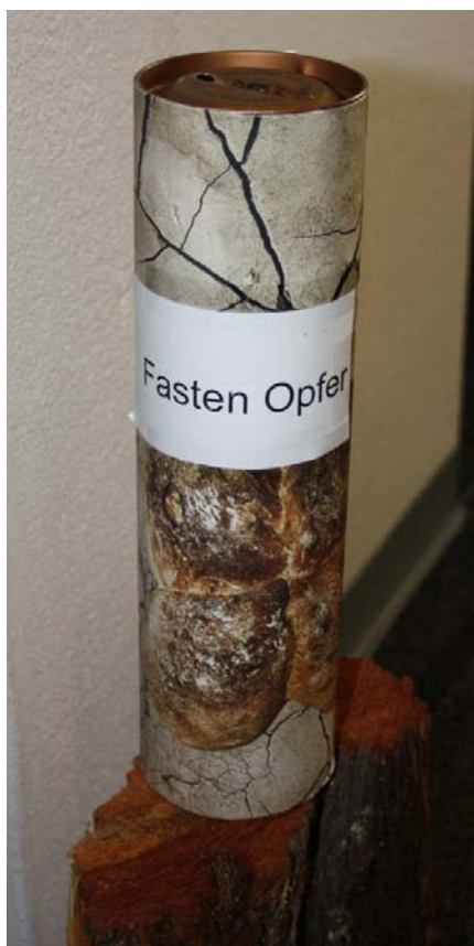
„Star des Tages“, die Fastenopferkasse

Erfreulich ist die Tatsache, dass der Sinn der Sache, gemeinsam für Benachteiligte Geld zu sammeln auch in diesem Jahr ein Erfolg war. Es kam ein ansehnlicher Betrag zusammen, welcher für das Fastenopferprojekt focus südafrika gespendet werden konnte.