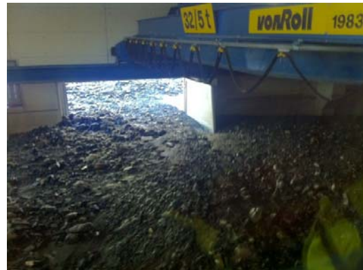
Die Überschwemmung hinterliess im Gebäudeinneren meterhohe Schlammmassen

Ab 10 Uhr stieg der Wasserpegel der Dala massiv an. Mit Angestellten, Feuerwehr und Baumaschinen versuchte man den reissenden Fluss vom Kraftwerk fernzuhalten. Vergeblich. Die Dala führte im Laufe des Tages immer mehr Hochwasser, so dass die Mitarbeiter der ReLL AG und der Kraftwerke Dala AG gezwungen waren, das Gebäude zu räumen. Verletzt wurde niemand.