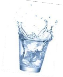
Wasser ist Leben!

In diesem Sinne wünsche ich euch allen genügend Wasser - in vernünftigem Rahmen zur rechten Zeit.