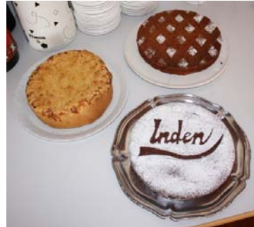
Spezielle Kuchenkreationen „made“ in Inden

Nach dem Suppenessen gab es Kaffee und selbstgemachte Kuchen, welche das Mittagessen kulinarisch abrundeten.