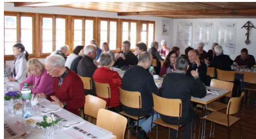
Gemütlich Beisammensein für die gute Sache

Bleibt zu hoffen, dass dies wegen des schönen Wetters so war und in den nächsten Jahren wieder viele Indner am Suppentag anzutreffen sind.