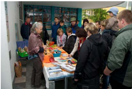
Traubenkernprodukte aus Varen

Die vorgesehenen Stände der vier Gemeinden wurden an trockenen Stellen aufgebaut, damit die Produkte trotz dem schlechten Wetter vorgestellt und/oder präsentiert werden konnten.