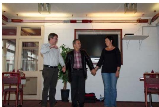
Die Präsidentin von Inden und der Präsident von Leukerbad als Bauchrednerpuppen – ein besonders Gaudi für die Anwesenden

Zum Schluss wurde ein feines Nachtessen serviert. Die Einwohnerinnen und Einwohner der DalaKoop-Gemeinden verbrachten zusammen einen fröhlichen Tag. Das Ziel des diesjährigen Anlasses wurde erneut vollumfänglich erreicht. Das Wetter konnte die Stimmung nicht trüben. Dies erfreute die Anwesenden und die Organisatoren gleichermassen.