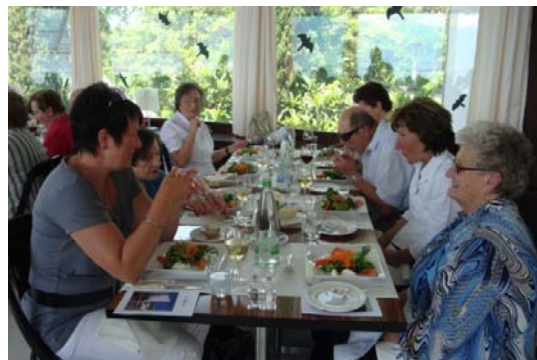
Mittagspause in Montreux