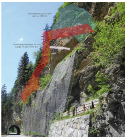
Tunnel Schleif – Schutzmassnahmen nötig

Das Gebiet im Raum Tunnel Schleif kurz vor Leukerbad ist basierend auf einer Studie stark steinschlaggefährdet. Um die Sicherheit auf der Strasse weiterhin zu gewährleisten müssen dringend Massnahmen umgesetzt werden. Diese wurden Ende 2011 eingeleitet und werden im laufenden Jahr abgeschlossen.