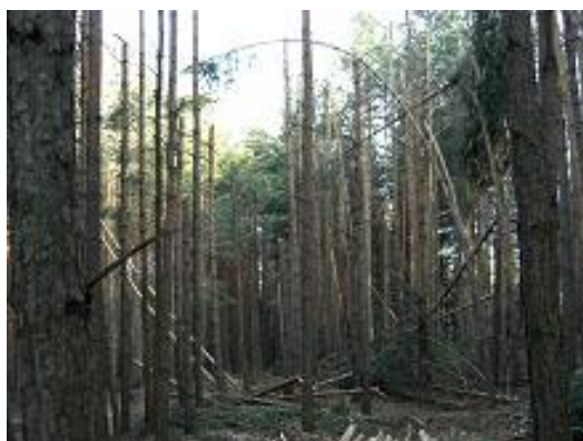
Grosse Gefahr durch Schneedruckschäden

Auf Grund der Schneedruckschäden ist der Druck auf das Holz im öffentlichen Wald stark gestiegen. Der Forstdienst stellte fest, dass bezüglich der Holzerei durch Private im öffentlichen Wald, Unklarheit herrscht und dass teilweise gesetzeswidrig Holz aus dem öffentlichen Wald entwendet wird. Dabei begeben sich Privatpersonen teilweise in grosse Gefahr.