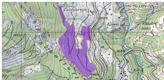
15 Hektare behandelt (violette Fläche)

Die Ansprüche an unsere Wälder haben sich in den letzten 40 Jahren stark gewandelt. War früher noch das Ziel im Wald qualitativ gutes Holz zu produzieren um dem regionalen Holzmarkt gerecht zu werden ist heute im „Indner Wald“ die Schutz und Erholungsfunktion im Vordergrund.