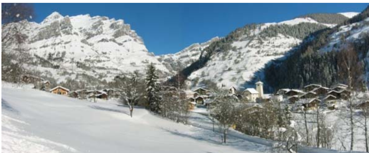
Herrliches Winterpanorama von Inden