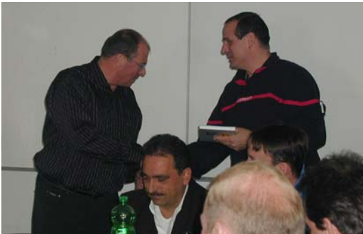
Der Kommandant der Feuerwehr Leukerbad-Inden wird mit Indens Kultur vertraut gemacht. Übergabe des Geschichtsbuches über Inden durch den Gemeindepräsidenten.

Einen grossen Dank aber auch an die Feuerwehrleute welche sich entschlossen haben weiterhin mit zu tun aber auch ein herzliches Dankschön an all jene Frauen und Männer von Inden welche der Feuerwehr lange Jahre Treue hielten und oft mit viel Einsatz in manch brenzlicher Situation gute Arbeit geleistet haben.