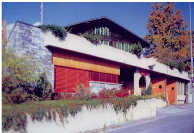
Gemeindebüro von Inden