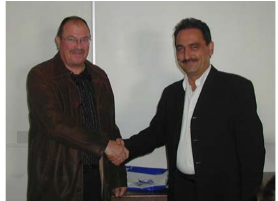
Die Gemeindepräsidenten von Leukerbad und Inden besiegeln die Fusion der Feuerwehren.

Nach eingehender Abklärung gewisser noch offener Fragen sowie nach definitiver Einholung der Vormeinung bei den Kantonalen Dienststellen hat die Verwaltung im Einverständnis mit der Feuerwehrkommission beschlossen ein Zusammengehen mit der Gemeinde Leukerbad vorzubereiten und auch zu realisieren.