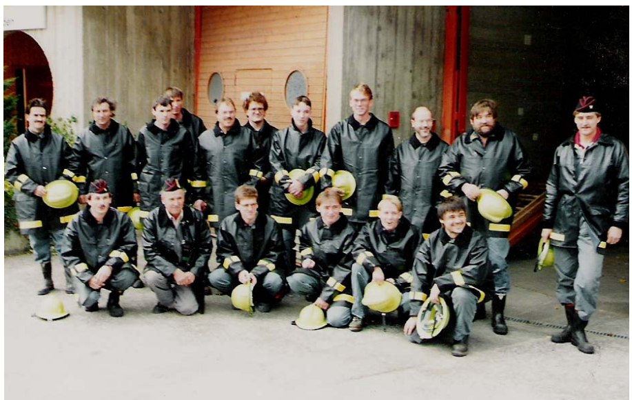
Feuerwehr Inden Mannschaft 1994