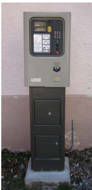
Parkuhr beim Konsum

Die Eigentümer von Häusern und Wohnungen können jedoch weiterhin kostenlos auf dem Gelände des Alten Bahnhofs parkieren. Hierfür benötigen Sie nur einen Parkausweis, der gut sichtbar hinter der Frontscheibe deponiert werden muss. Diesen Ausweis, der jeweils für ein Kalenderjahr ausgestellt wird, können Sie während den üblichen Öffnungszeiten im Gemeindebüro abholen.