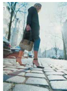
Schon bei guten Straßenverhältnissen verlangt das Gehen mit solchen Absätzen einiges an Geschick. Bei Nässe, Glätte und auf unebenen Belägen ist ein Sturzunfall schon fast programmiert.

Fahrzeuge tragen, können die Gänge in Rutschbahnen verwandeln. Um Stolper-, Rutsch- und Sturzunfälle zu vermeiden, sind daher zwei Dinge besonders wichtig: Aufmerksamkeit und geeignetes Schuhwerk . Die Berufsgenossenschaften und die SUVA empfehlen, vor allem im Winter Schuhe mit Profilsohlen aus Gummi zu tragen, die die Knöchel fest umschließen. Für den Weg zur Arbeit und für Dienstgänge sollte stets genügend Zeit eingeplant werden. Wer unter Zeitdruck unterwegs ist, achtet kaum noch auf den Weg. Um sich nicht ablenken zu lassen, sollten Fußgänger außerdem Nebentätigkeiten wie etwa Telefonieren vermeiden.